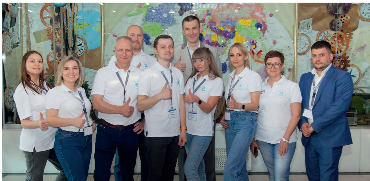
Мебельная конференция, г. Хабаровск

Теплая и дружественная атмосфера мероприятия, информационная наполненность и комментарии профессионалов Компании ТБМ позволили специалистам отрасли углубить свои знания о мебельных комплектующих из ассортимента Компании ТБМ. Участники активно обсуждали новинки, делились мнениями и находили единомышленников, а также познакомились с актуальными трендами в дизайне и производстве мебели, обсудили новые механизмы и решения для кухонной и корпусной мебели. На площадке была оборудована специальная выставочная секция, на которой участники смогли протестировать продукцию и задать вопросы экспертам.