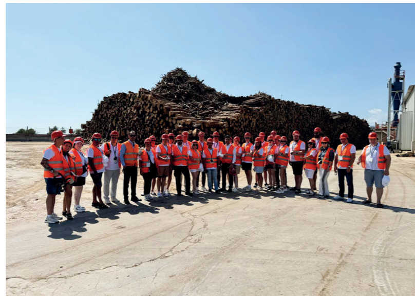
ИП «Губанов», ИП «Леваян», ООО «Мебель Комфорт», ООО «Лорена», ООО «Старт» и ООО «ПК «Ангстрем».