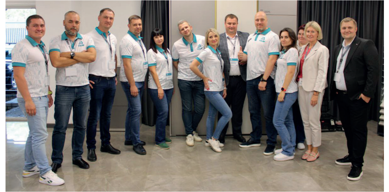
Мебельная конференция, г. Саратов

Клиентская конференция по мебельным комплектующим собрала более 40 представителей различных компаний со всего региона. В фокусе внимания были новинки ассортимента, открывающие новые возможности для производителей мебели, в том числе и ящики Crystal, и подвесные системы для шкафов-купе с наполнением. Не обошли вниманием и продукты, которые положительно зарекомендовали себя на рынке: подъемные механизмы DTC, ящики и направляющие FIRMAX, петли FIRMAX, плитные материалы производителей AGT и ALVIC, стеновые профили AGT.