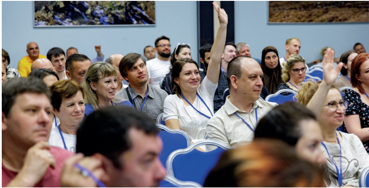
Мебельная конференция, г. Пятигорск

Теплая и дружественная атмосфера мероприятия, информационная наполненность и комментарии профессионалов Компании ТБМ позволили специалистам отрасли углубить свои знания о мебельных комплектующих из ассортимента Компании ТБМ. Участники активно обсуждали новинки, делились мнениями и находили единомышленников, а также познакомились с актуальными трендами в дизайне и производстве мебели, обсудили новые механизмы и решения для кухонной и корпусной мебели. На площадке была оборудована специальная выставочная секция, на которой участники смогли протестировать продукцию и задать вопросы экспертам.