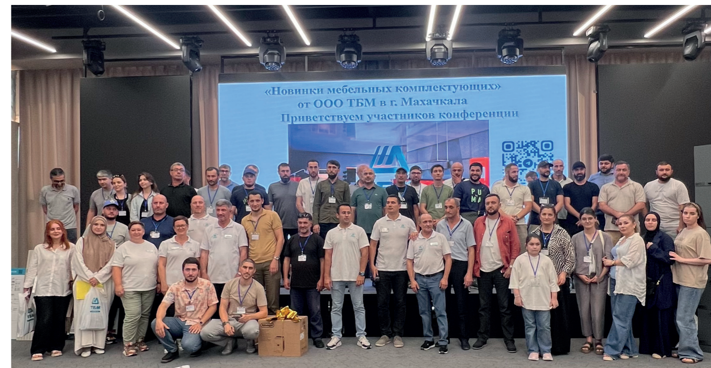
Мебельная конференция, г. Махачкала

В 2024 году Компания ТБМ провела серию крупных клиентских мероприятий, которые выступили в роли платформы для обсуждения актуальных трендов, инновационных технологий и новых продуктов. Эти конференции собрали профессионалов из различных уголков страны, предоставив им возможность обменяться опытом и наладить деловые контакты.