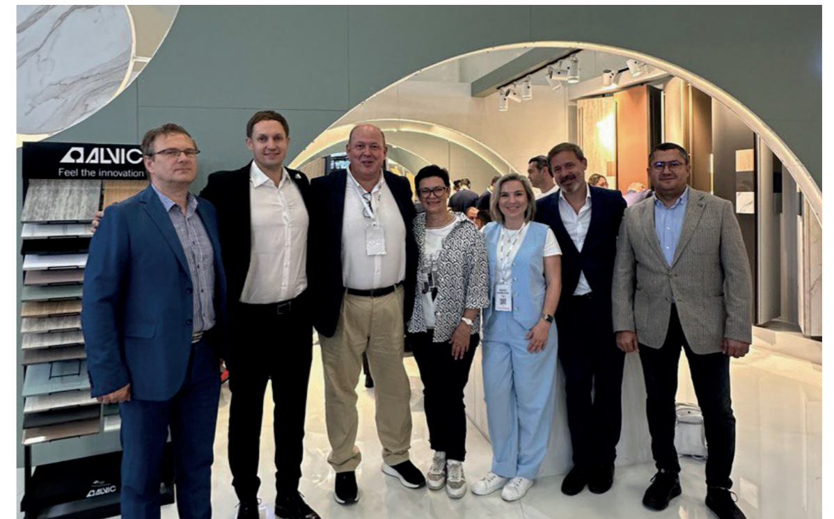
| Вдохновение от новых коллекций