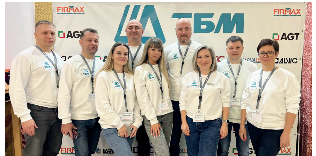
Мебельная конференция, г. Владивосток

Посетители также проявили интерес к автоматическому пантографу и мини-сейфу из коллекции AIDEN. В перерывах участники могли задать вопросы сотрудникам по техническим нюансам фурнитуры, что способствовало более глубокому пониманию представленных решений.