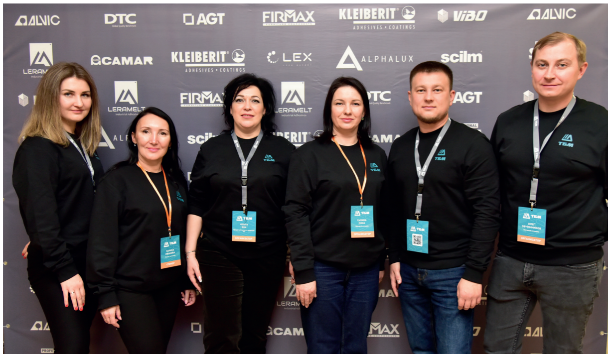
Мебельная конференция, г. Омск

Все клиенты отметили высокий уровень организации мероприятия, были приятно удивлены подарками каждому участнику выставки в виде образцов, купонов на скидки, а также полезных вещей для мебельщика (лазерные уровни, рулетки). Посетители отметили качественную подачу материала спикерами и компетентные ответы на вопросы по продукту.