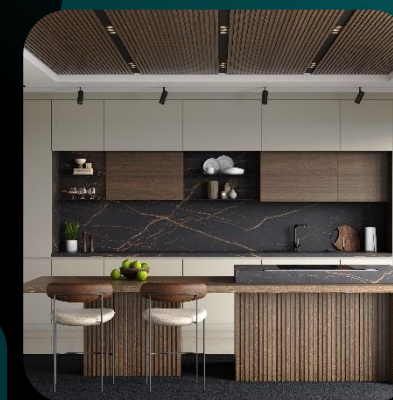
Комплектующие для мебели