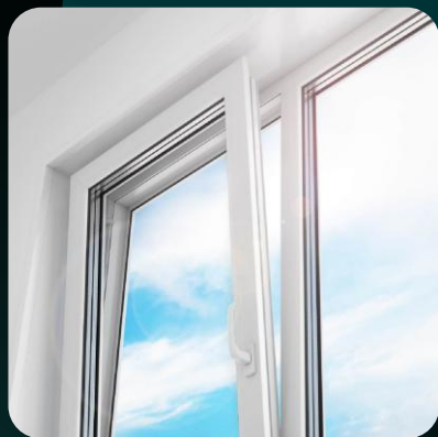
Комплектующие для окон