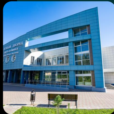
Комплексные решения для алюминиевых фасадов