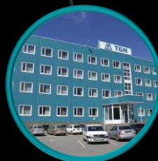
Rostow am Don