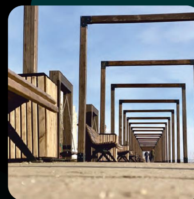
Lackmaterialien und Klebstoffe